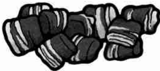
■牛カレー用トレイ用